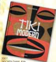
2007 TASCHEN GmbH, Köln ISBN 978-3-8228-4717-6