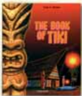
2003 TASCHEN GmbH, Köln ISBN 3-8228-2433-X